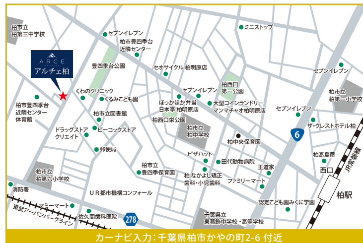
カーナビ入力: 千葉県柏市かやの町2-6 付近

TVアンテナ(電波障害)によるケーブルTV、共聴アンテナの申込みはお客様負担となります。電気供給のため、敷地内に電柱及び支線が入る場合があります。※所有権移転手続きにおいて当社指定の司法書士を利用して頂きます。※建築条件付売地とは、土地売買契約後3ヶ月以内に当社(土地の売主)と建物請負契約を締結することを条件として販売します。この期間内に建築請負契約が締結されない場合は、土地売買契約はなかったこととなり、預り金等問わず、受領済みの金額は無条件で速やかに全額をお返しします。